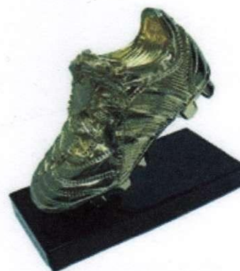
приз «Золотая бутса»