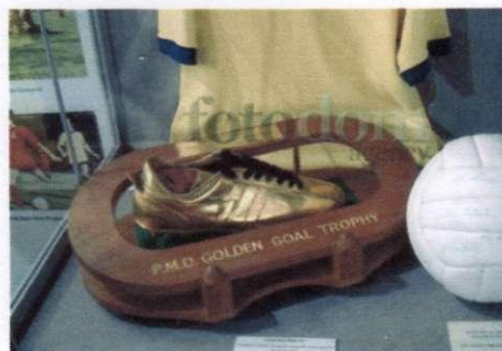
приз «Золотой гол»

www.fotoblog.ru/2008/12/08/Самые_великие... История футбольного клуба "Арсенал", Лондон, Северный Лондон, 27 июля 2005. На фото: приз "Золотой гол" (London Goal Trophy)