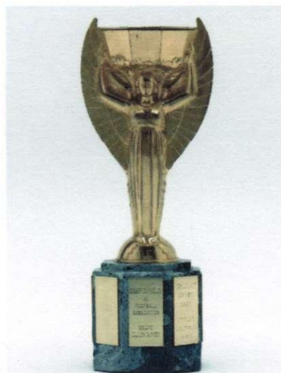
кубок «Золотая богиня»