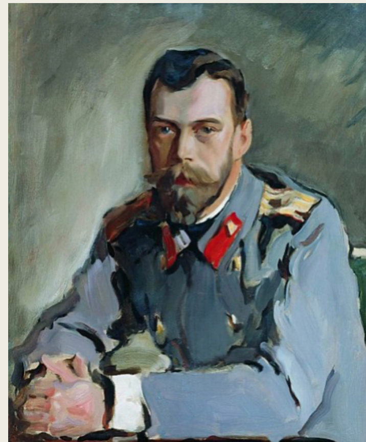
Портрет Николая II в офицерской тужурке Преображенского полка. Худ. Серов В. А. , ок.1900 г.